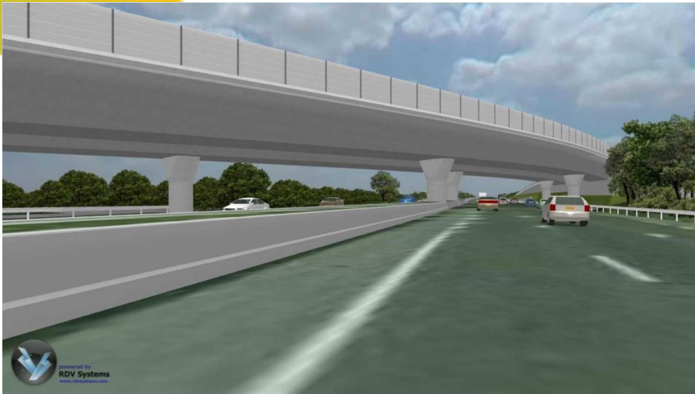
הדמיה ממבט הנוסע בכביש 6 צפונה